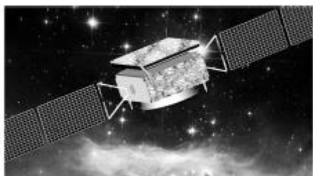
图 1.1 图标题