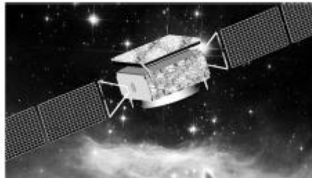
图 1.1 图标题